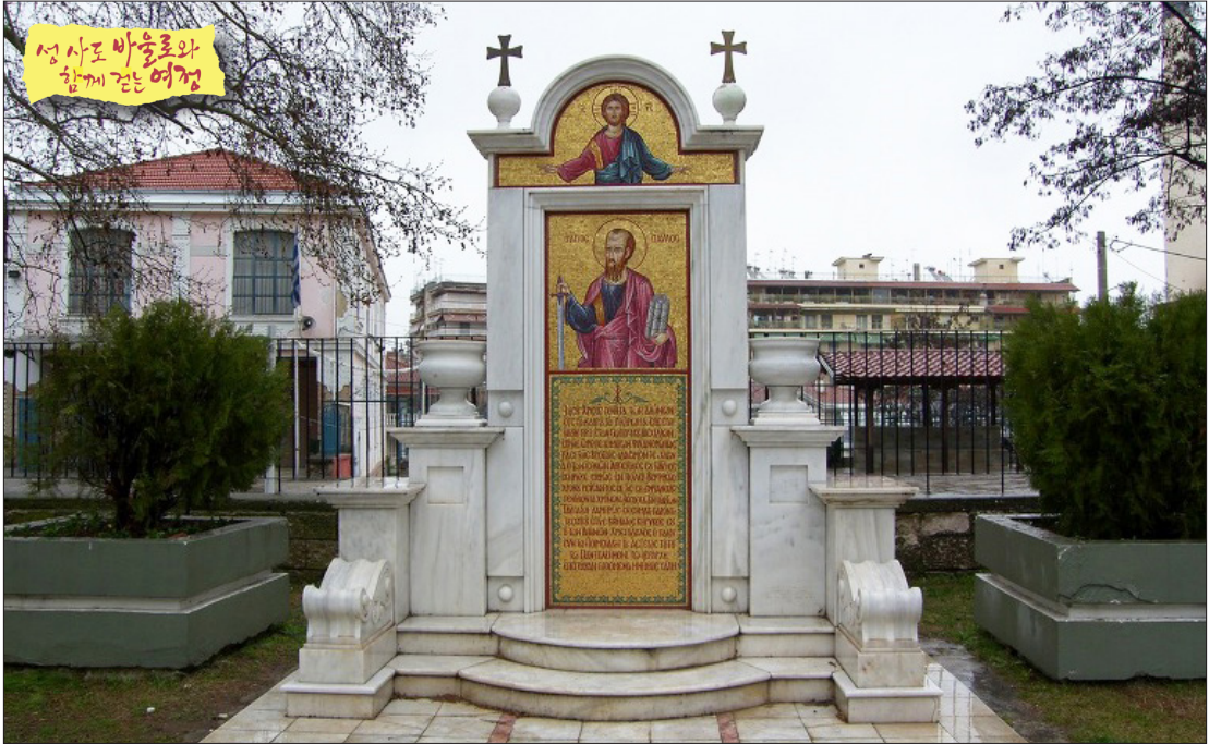
성 사도 바울로의 발자취를 기념하는 베레아의 설교 장소, 말씀을 받아들인 믿음의 자리

한국 정교회 대교구 | 서울 마포구 마포대로 18길 43 | Tel.(02)362-6371 | Fax.(02)365-2698 | orthodoxkorea.org