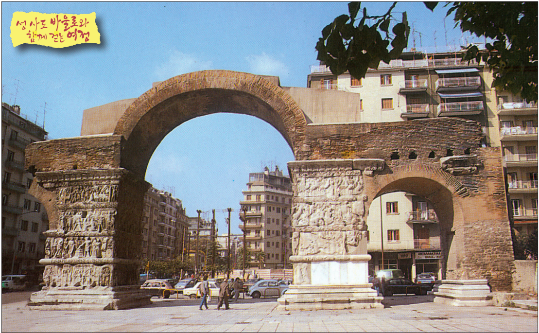
바울로 사도가 걸었던 길에 세워진 데살로니카의 로마 시대 유적, 갈레리우스 개선문

한국 정교회 대교구 | 서울 마포구 마포대로 18길 43 | Tel.(02)362-6371 | Fax.(02)365-2698 | orthodoxkorea.org