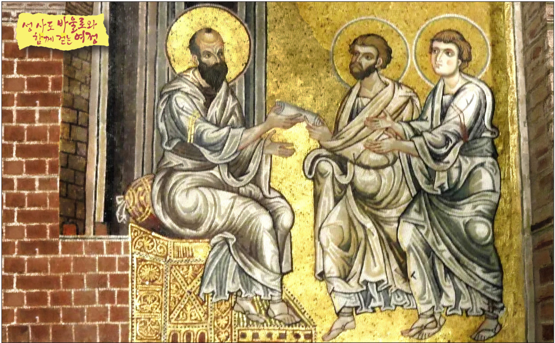
제2차 선교 여행을 시작하며 동역자 실라와 디모테오에게 복음과 사명을 전하는 바울로 사도

한국 정교회 대교구 | 서울 마포구 마포대로 18길 43 | Tel.(02)362-6371 | Fax.(02)365-2698 | orthodoxkorea.org