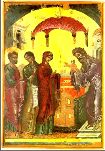
(예루살렘 성전에 입당하시는 주님)

주 예수 그리스도 입당 축일 오전 9시 : 조과 및 성찬예배 (각 성당 예배는 문의 바랍니다.)