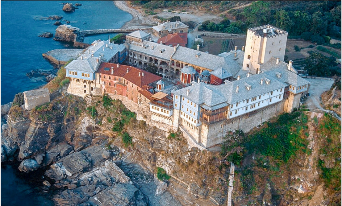
<아토스 성산의 수도원 탐방 7> 판토크라토르 수도원(사진)은 아토스 성산 동쪽 해발 40~50m 바위 위에 자리 잡고 있으며, 14세기 중반에 설립되었다. 1390년과 1773년에 화재로 소실되었으나 재건되었다. 성모님 전신(全身) 성상이 유명하며, 350권의 필사본과 3,500여 권의 도서를 소장하고 있다. 또한 성 안드레아 사도, 성 요한 크리소스톰의 유물도 보존하고 있다. 15개의 성당이 있다.

한국 정교회 대구구 | 서울 마포구 마포대로 18길 43 | Tel.(02)362-6371 | Fax.(02)365-2698 | orthodoxkorea.org