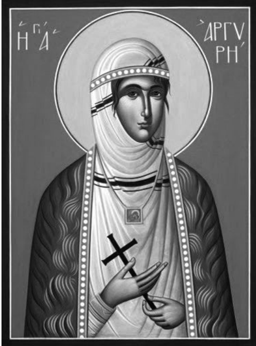
성 아르기리 새 순교자