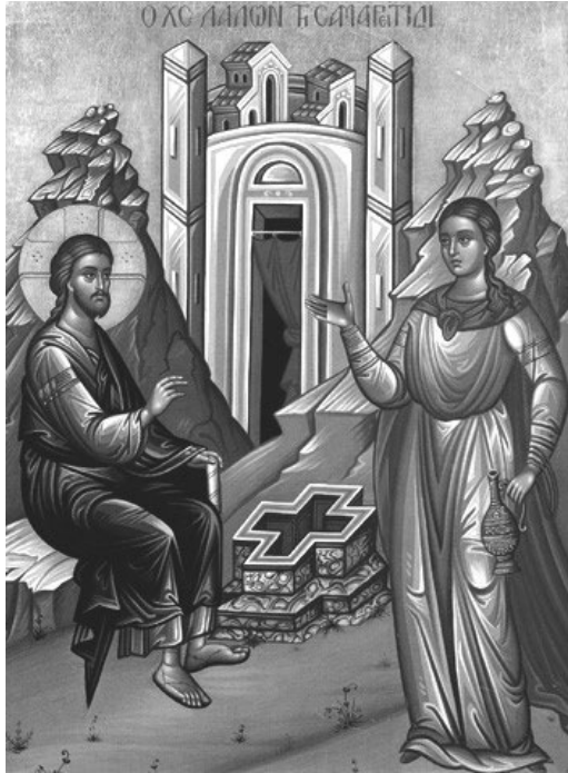
성 포티니 사마리아 여인