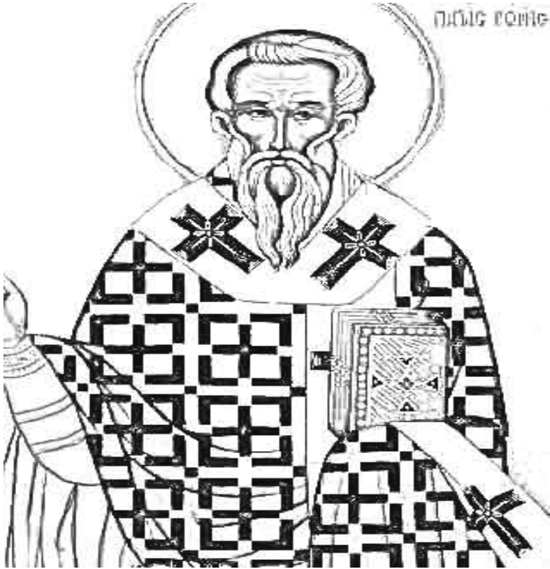
성 클리멘트 로마 주교