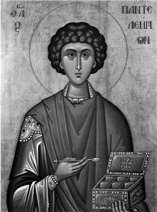
성 뻬텔레이몬 대순교자